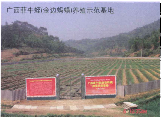
广西菲牛蛭（金边蚂蟥）养殖示范基地